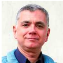
JUAN RAMÓN LUCAS

La crisis económica está acompañada por una crisis ética muy grave y por una crisis política que se mueve entre la impotencia y la desorientación.